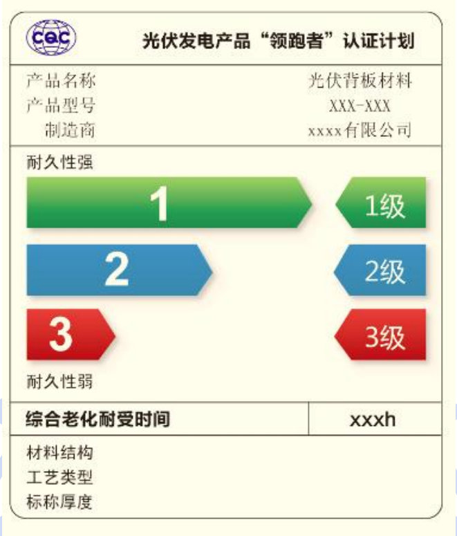
图 4 光伏背板材料环境耐久性等级标识示例

注：标识是用于显示产品满足有关标准和技术规范中的性能要求。以彩带区分符合类别，以“1级”代表该产品经受 4000h 环境耐久性考验，“2级”代表该产品经受 3000h 环境耐久性考验，“3级”代表该产品经受 2000h 环境耐久性考验。