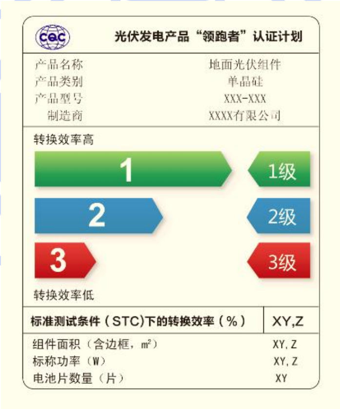
图 1 光伏组件转换效率等级标识示例

注：组件实际转换效率的确定是在标准测试条件下（AM1.5G、组件温度 25℃，辐照度 1000W/m 2 ）光伏组件最大输出功率与照射在该组件上的太阳光功率（1000W/m 2 乘以电池片的面积）的比值。