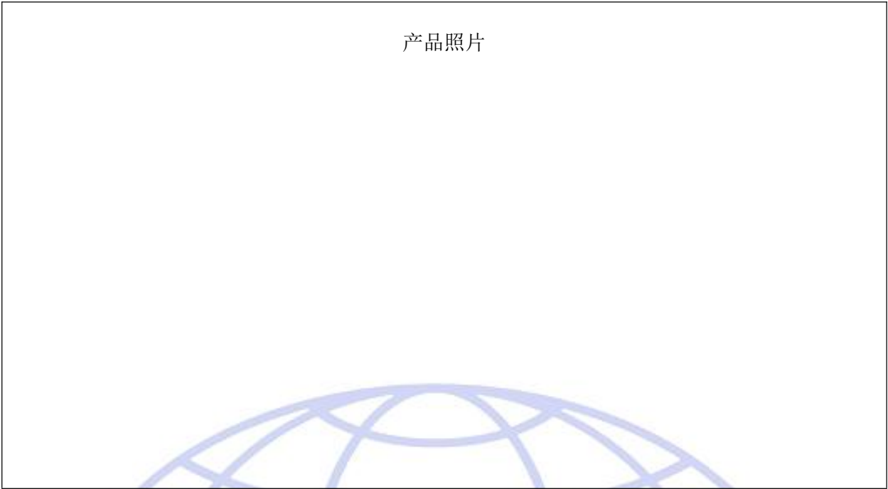
关键零部件/材料清单