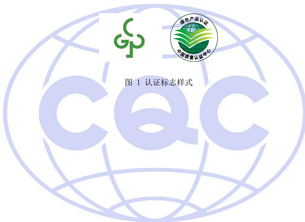
图 1 认证标志样式

通过认证并取得认证证书的企业可在获准认证的产品本体、铭牌、包装、随附文件（如说明书、合格证等）、电子销售平台等位置使用或展示绿色认证标识，样式见图 1。获证企业在使用标识时，应符合《绿色产品标识使用管理办法》（国家市场监督管理总局 2019 年第 20 号）及 CQC 认证标志管理办法的要求。