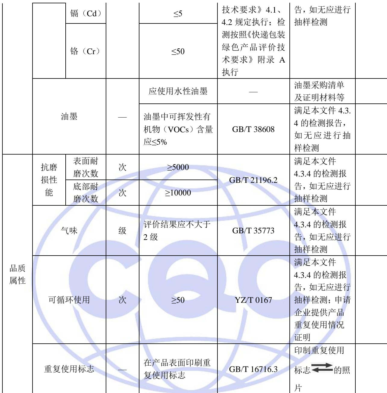
表 2-7 纸质填充物自评价表