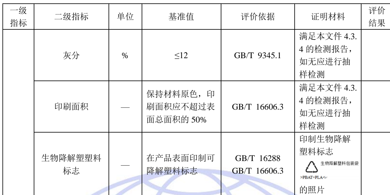
表 2-5 电子运单自评价表