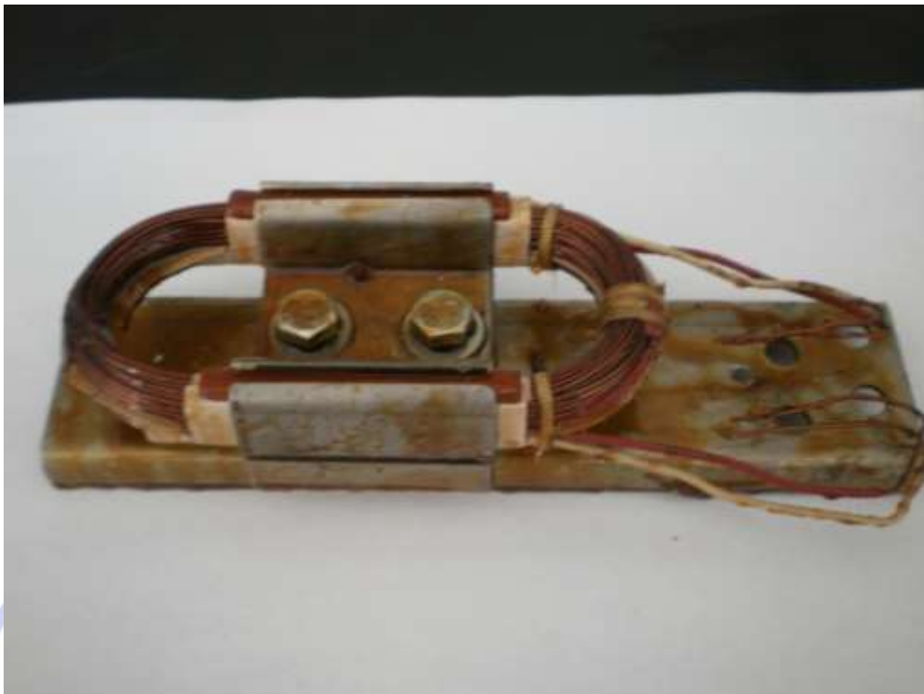
图 1 模型线圈实物图