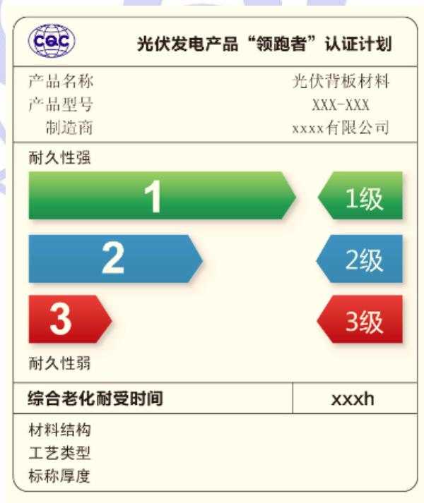
图3 光伏背板材料环境耐久性等级标识示例

注：标识是用于显示产品满足有关标准和技术规范中的性能要求。以彩带区分符合类别，以“1